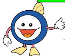
下水道マスコットキャラクター