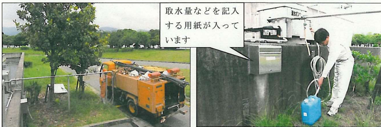
タンクローリー車など